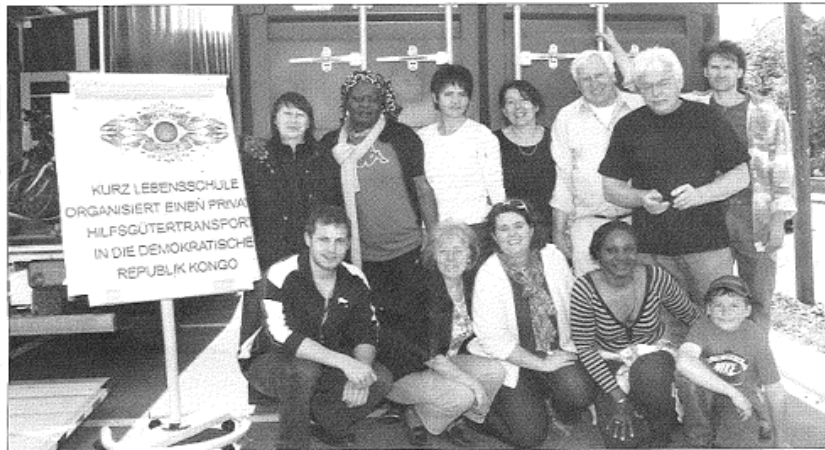
Der Verein Rock & Pearl bietet die etwas andere Hilfe in der Demokratischen Republik Kongo.

Der Verein Rock & Pearl bietet die etwas andere Hilfe und bezweckt die Förderung der einheimischen KMU in Afrika. Er besteht aus einer Gruppe von aktiv in Afrika engagierten Schweizern, die die These aufstellt, dass anstelle von Kapital auch Restposten unserer Überfluggesellschaft in Kommission zur Verfügung gestellt werden sollten. Dadurch müsste sich der Effekt verdoppeln, indem das Kleingewerbe auch gleich in den Genuss äusserst günstiger Waren kommt. Die Waren werden anfänglich wie Mikrokredite in Kommission vergeben. Der Empfänger zahlt erst, wenn er die Ware oder das damit erzeugte Produkt verkauft hat. Er muss sich aus dem Erlös auch ein kleines Eigenkapital erwirtschaften. Rock & Pearl kauft die Ware in der Schweiz ein, durchstöbert Brockenhäuser, sucht nach Liquiditätsposten, erstergt Ware bei Ricardo, E-Bay, etc. Es öffnen sich mehr und mehr Türen der Zusammenarbeit. So bezieht Rock & Pearl z.B. recycelte PCs und Drucker