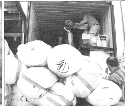
Eifrig wird gepackt, verklebt und verstaut.